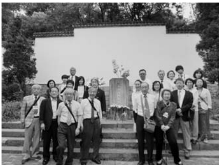
張廉卿公墓の前で

一方の文化園は、村民から寄せられた張募金により、二〇一二年に完成された張廉卿書法の殿堂です。張裕釗の作品(すべて原寸大の複製による)のほか、歴史資料、文献