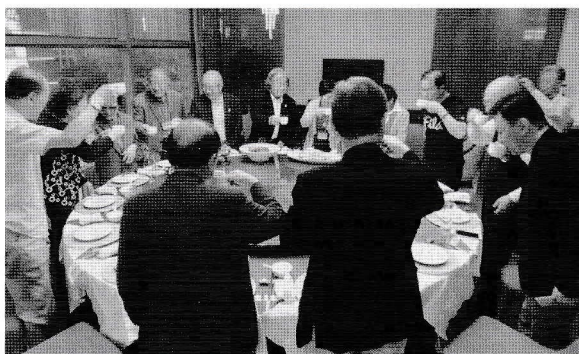
張廉卿子孫のご家族と夕食会